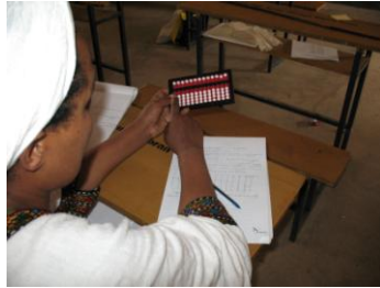
rekenen met de abacus