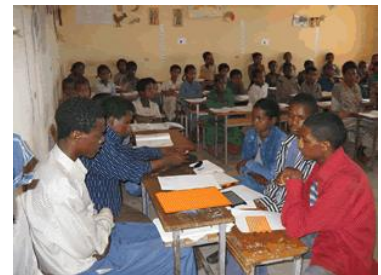
integratie in een reguliere klas

Voor 2013/2014 wil Lalibela het onderwijs aan blinden breder trekken naar alle scholen in Lalibela. Hiervoor is medewerking van de lokale overheid en schooldirecteuren van cruciaal belang. Daarom worden voor hen "awareness" cursusdagen georganiseerd om hen bewust te maken van het belang van onderwijs aan deze groep jongeren. Tevens wordt geïnventariseerd hoe groot de groep jonge visueel gehandicapte kinderen is deze specifieke vorm van onderwijs nodig hebben.